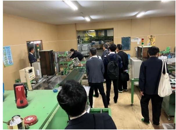
(生産施設見学の様子 @浜縮緬工業協同組合精練加工場)