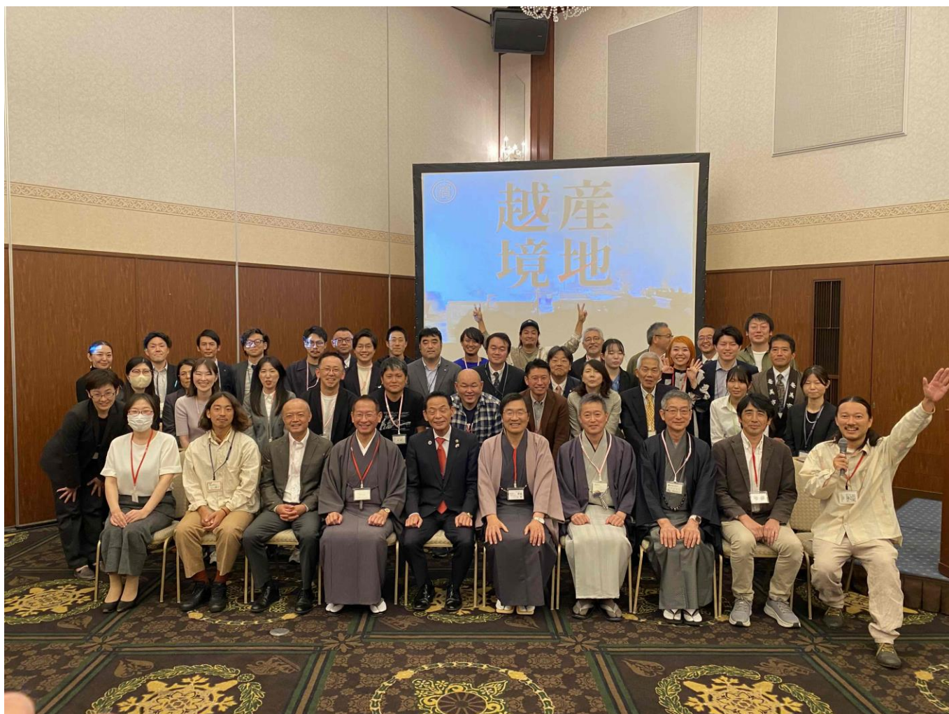
(滋賀県長浜市で開催した「産地越境プロジェクト」より)