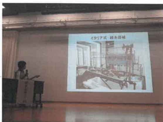
官営富岡製糸場で採用されたフランス式と藩営前橋製糸所で採用されたイタリア式の生糸の抱合装置について