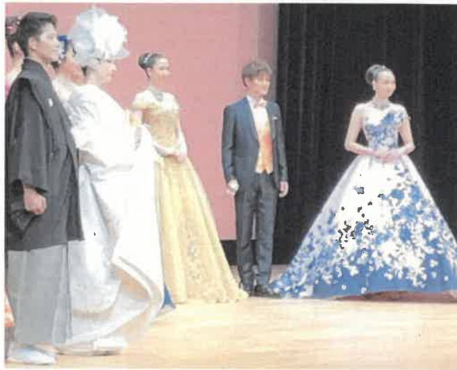
写真2 ユミカツラ ファッションショー風景