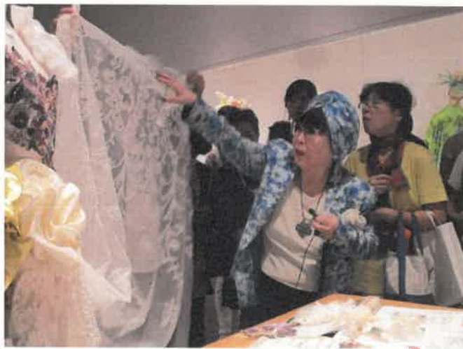
写真3 企画展ギャラリートーク