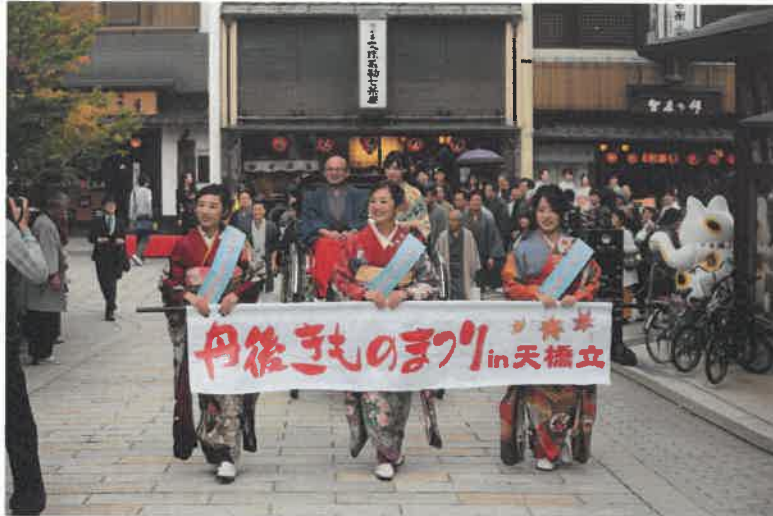
丹後きものまつり in 天橋立（京都府宮津市）