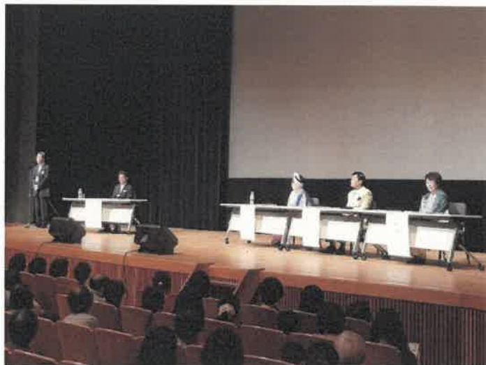
写真1 パネルディスカッションに先立って今井竜五岡谷市長挨拶

異なる分野の3名の先生からのお話で、日本のシルク文化とシルクの魅力を再認識したパネルディスカッションとなりました。