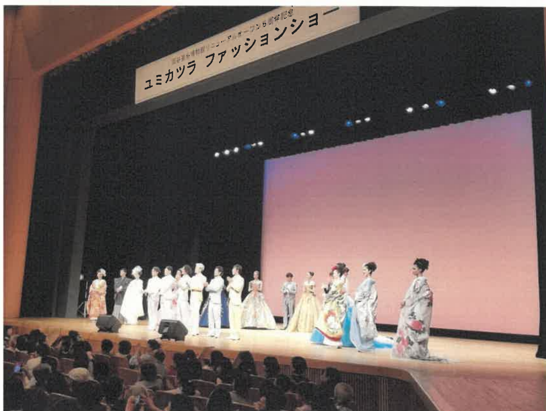
岡谷蚕糸博物館リニューアルオープン5周年記念事業 (ユミカツラ ファッションショー)